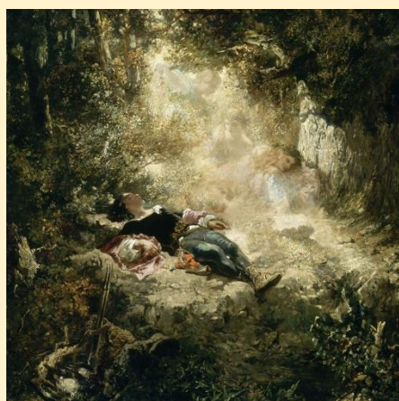
Un rayon de soleil, 1848 Musée de Valenciennes