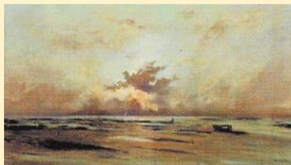
Environs de Villerville, marée basse, soleil couchant