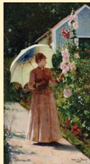
Elégante en promenade devant des roses-trémières